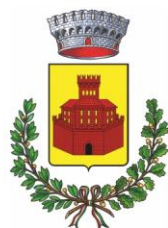
Costa di Mezzate